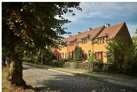
Berlin, Falkenberg

Obdivujte jedinečný stavební koncept 6 berlínských modernistických obytných čtvrtí. Čtvrti byly postaveny v letech 1913 až 1934 jako alternativa k ponurým činžákům císařské éry a vycházela z konceptu "světla, vzduchu a slunce". Svými jasnými formami utvářely architekturu a urbanismus 20. století, jsou mimo jiné snadno dostupné i autobusovou prohlídkou.