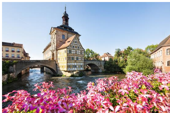
Bamberg, Stará radnice

V Německu na Vás čeká aktuálně 51 památek zapsaných na seznamu světového dědictví UNESCO. Od historických památek a poutních míst přes interaktivní muzea po archeologické parky a další aktivity: O vaše toučky bude postaráno, ať už se vydáte třeba k sedmi památkám světového dědictví podél říčních krajín Rýna a Mosely, projdete největší evropský horský park nebo se rozhodnete poznávat historii starou 7000 let. Přinášíme malou ochutnávku toho, co při svých toukách Německem, můžete navštívit.